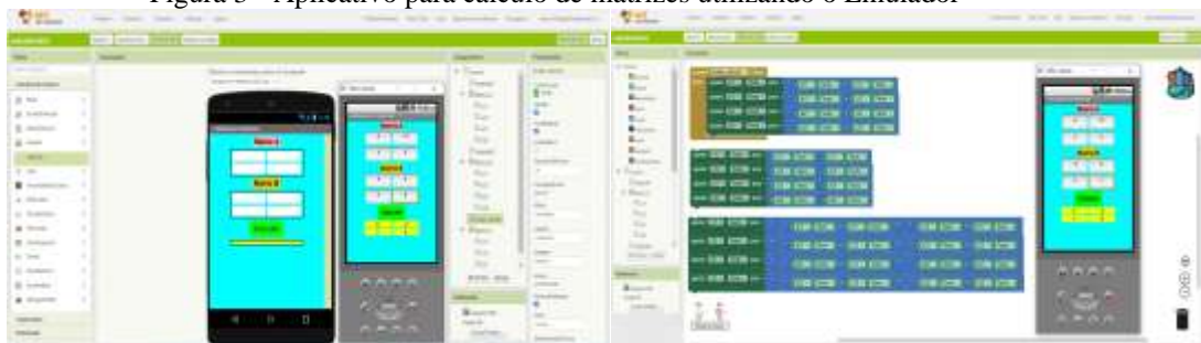
Figura 3 - Aplicativo para cálculo de matrizes utilizando o Emulador

O Mit App Inventor 2 permite a criação de aplicativo para cálculo de matrizes, podendo ser testado em um celular, tablet ou computador. Para testar, a plataforma permite instalar um Emulador disponível em https://appinventor.mit.edu/explore/ai2/setup-emulator.html no computador para simular o ambiente Android, conforme ilustrado na figura 3.