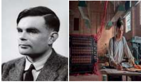
Figura 2 - Alan Turing e cenas do filme