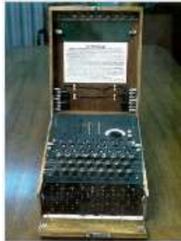
Figura 1- Máquina Enigma

A história da criptografia divide-se em dois períodos: criptografia clássica e criptografia moderna . A criptografia clássica foi utilizada pelos povos mais antigos até o surgimento das primeiras máquinas eletro-mecânicas, que foram utilizadas principalmente durante a Segunda Guerra Mundial. Já a criptografia moderna, desenvolveu-se durante a Segunda Guerra Mundial, quando era essencial manter informações secretas contra possíveis ataques de países adversários e, a partir daí, o alemão Arthur Scherbius em 1918 construiu a primeira máquina, chamada de “Enigma” para cifrar/decifrar códigos. Muito utilizada na época, essa máquina era composta de três elementos, sendo eles: um teclado para digitar a mensagem original, um misturador que permutava o alfabeto e uma tela para visualizar a mensagem codificada, conforme pode ser observado na Figura 1.