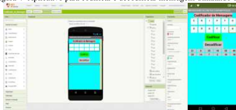
Figura 4 -Aplicativo para codificar e decodificar mensagens utilizando o Celular

Outra funcionalidade do Mit App Inventor 2 é que permite a criação de aplicativos para codificação e decodificação de mensagens, e caso não deseja testá-lo no Emulador, basta instalar o MIT AI2 Companion no celular disponível em https://play.google.com/store/apps/details?id=edu.mit.appinventor.aicompanion3&hl=pt_BR&gl=US , como pode ser visualizada na figura 4.