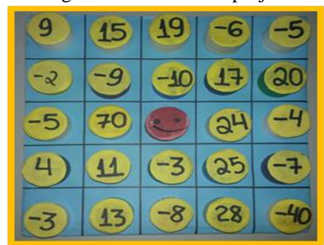
Figura 7 – Jogo Matix.

Os assuntos matemáticos presentes no Matix podem ser trabalhados em diferentes turmas do Ensino Fundamental II. Dentre os conteúdos abordados nesta ferramenta encontram-se as expressões numéricas e os números inteiros. O jogo pode explorar o raciocínio lógico do aluno, fazendo com que o discente desenvolva no decorrer da atividade capacidade para realizar exercícios que abordam resolução de problemas do cotidiano.