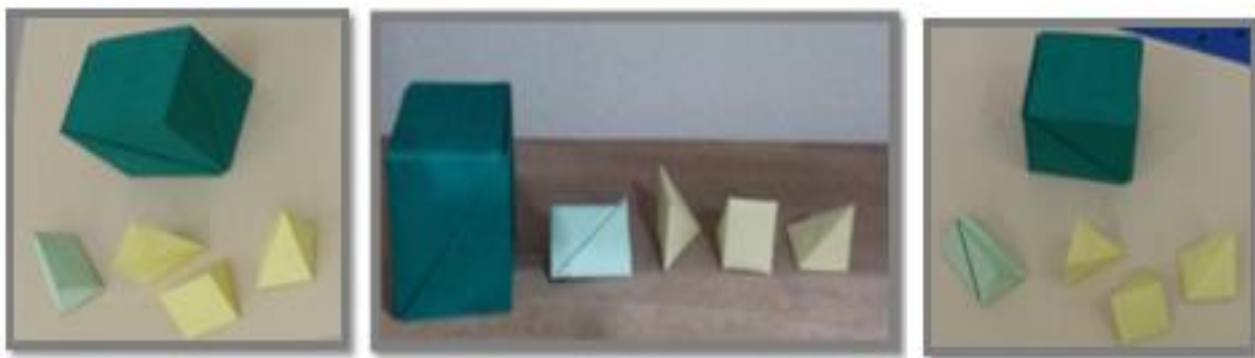
Figura 4 – Material didático para trabalhar decomposição do cubo e prisma.

decomposição do prisma em três pirâmides congruentes foram utilizados para confecção da ferramenta folha de cartolina e para confecção da decomposição do cubo em três pirâmides congruentes utilizou-se papel cartão. Foram desenhadas três pirâmides nos dois materiais descritos e no segundo momento da confecção foram realizadas dobraduras e colagens das laterais de cada sólido. No ano de 2018, o material da figura 4 foi doado para o Laboratório de Ensino de Matemática do Araguaia (LEMA).