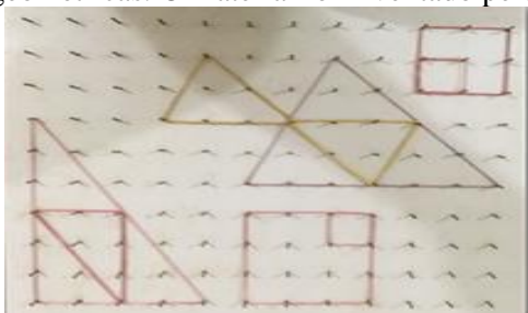
Figura 2 – Geoplano com algumas figuras geométricas.

O Geoplano do IEA foi confeccionado em madeira e pregos pequenos. Foi traçada uma malha com totalidade de 120 pregos na base para segurar os elásticos no qual pudessem formar diversas figuras geométricas. O material foi inventado pelo matemático inglês Callebe Gattegno em 1961.