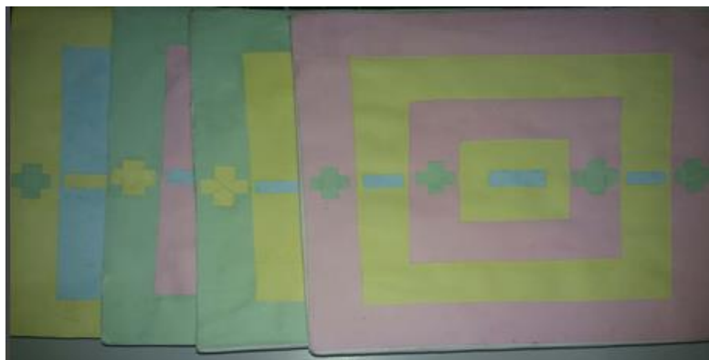
Figura 8 – Jogo Perdas e Ganhos.

Na construção da base do material foram utilizadas cartolinas de cores diferentes e papelão. Para pedrinhas que seriam arremessadas foram utilizadas sementes de milho de pipoca. Na malha do material colamos sinais de positivo e negativo feitos de cartolina. O jogo Perdas e Ganhos teve o objetivo de trabalhar os conteúdos de regras de sinais e expressões numéricas, assuntos estudados no Ensino Fundamental II. Para realizar o jogo é necessário que os alunos joguem no tabuleiro algumas sementes e a partir daí comecem a gerar algumas expressões numéricas observando e anotando quantas sementes caem em cada coluna de sinais que estão relacionadas com as regras dos sinais.