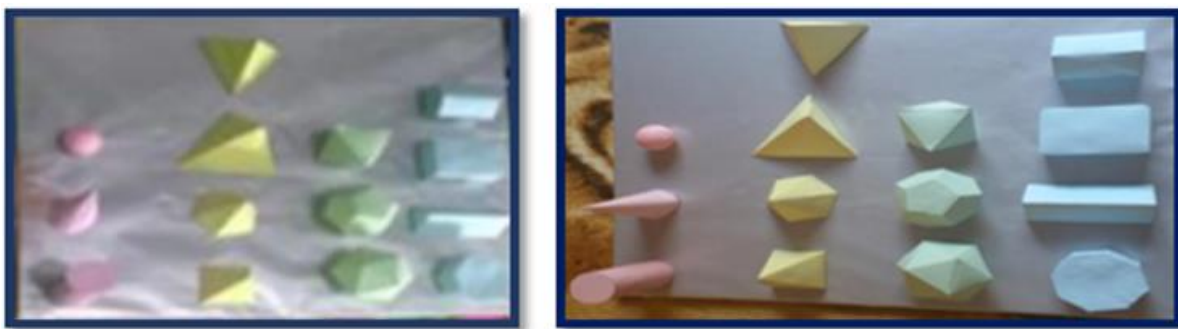
Figura 9 – Maquete com alguns sólidos geométricos.