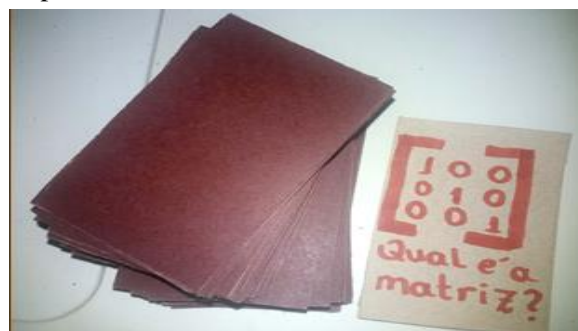
Figura 5 – Jogo de Cartas.

A ideia do material é que os alunos participem trabalhando as teorias dadas em sala e todos do grupo sejam vencedores. Esse jogo foi aplicado aos alunos do Ensino Médio, enfatizando conceitos de: progressão aritmética nas turmas do primeiro ano e definições de matrizes nas turmas do segundo ano. O material também pode ser desenvolvido para alunos do Ensino Fundamental II, bastando o professor transmitir para as cartas o conteúdo que a turma está aprendendo.