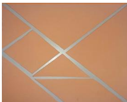
Figura 3 – Tangram com sete peças.

Confeccionado com EVA, foi desenhado um quadrado na folha do EVA e a partir desse quadrado houve a separação das sete peças do tangram, sendo elas: dois triângulos grandes, dois triângulos pequenos, um triângulo médio, um paralelogramo e um quadrado.